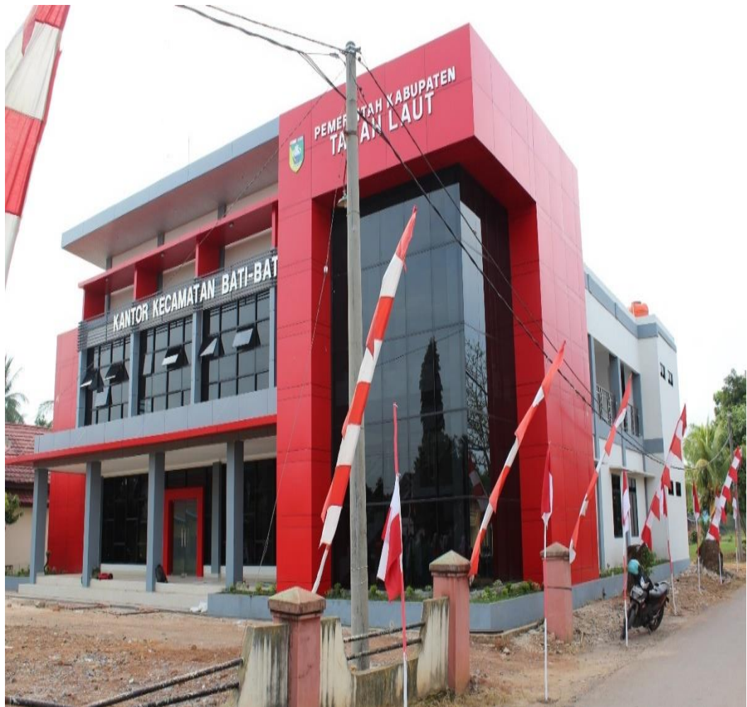
Gambar: 2 Gedung Kantor Kecamatan Bati Bati

tahun 2015 dan 2016 dan dimanfaatkan pada tahun 2017. Gedung kantor Kecamatan Bati Bati dibangun diatas tanah milik Pemerintah Daerah Kabupaten Tanah Laut dan sumber dana pembangunan berasal dari APBD Tanah Laut secara bertahap yaitu tahun Anggaran 2015 dan 2016. Anggaran pembangunan gedung kantor Kecamatan Bati Bati sebesar Rp. 4.446.158.300,- dengan luas bangunan 1.104 M2.