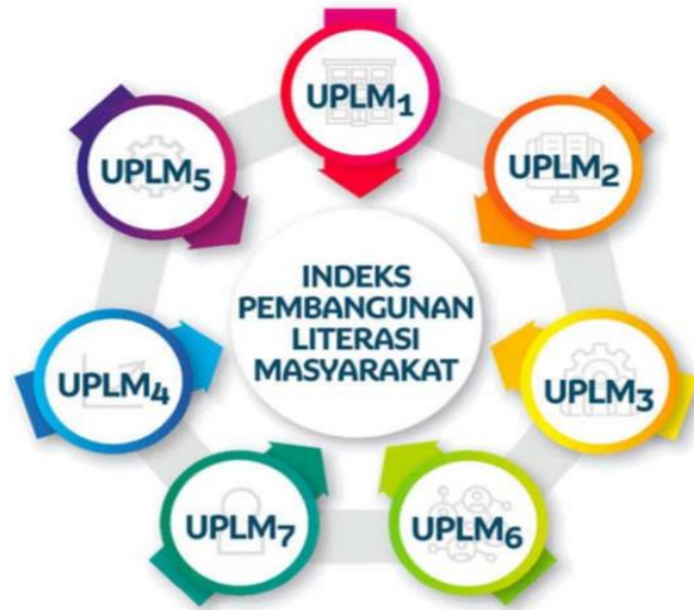
Gambar 1.1 Tujuh Unsur Pembangunan Literasi Masyarakat