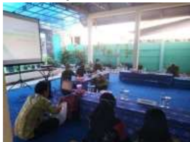
RAT. Kop Usaha Bersama