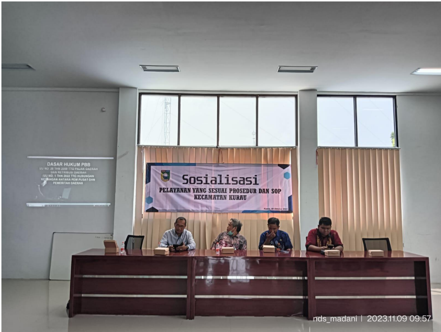
Keterangan : Kegiatan Pelayanan