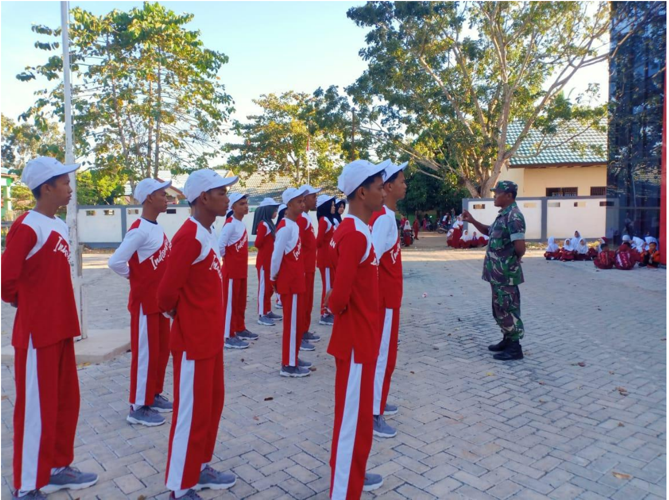
Keterangan : Paskibraka Tahun 2024