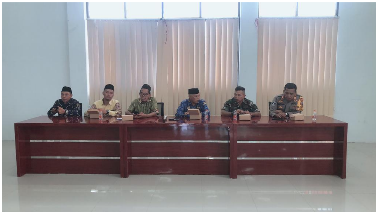
Keterangan : Kegiatan Forkopimcam