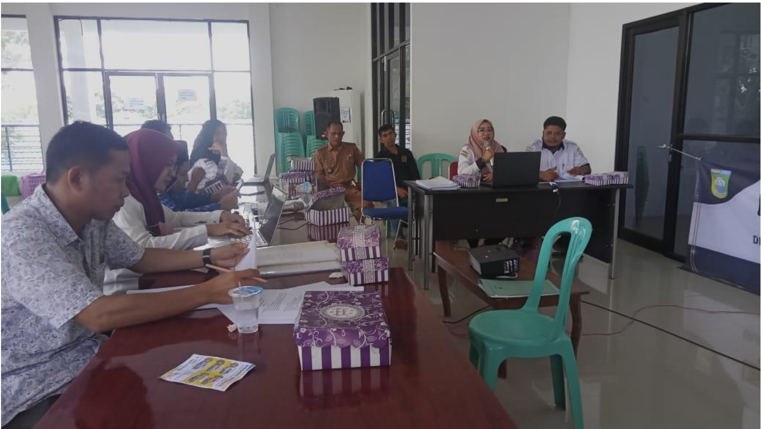
Keterangan : Evaluasi RAPBDes