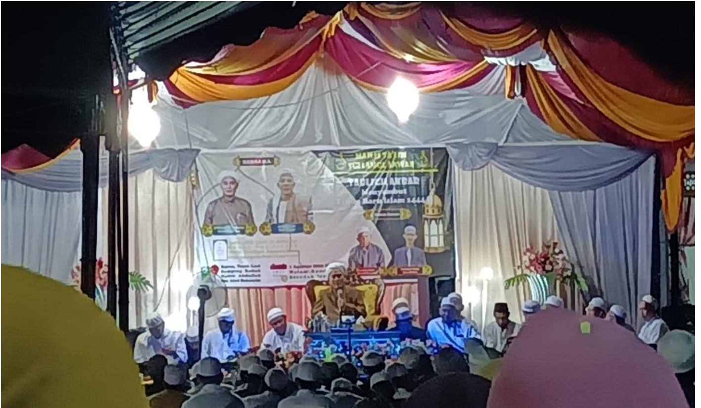
Keterangan : Pelaksanaan Kegiatan Dana Hibah Tahun Anggaran 2024