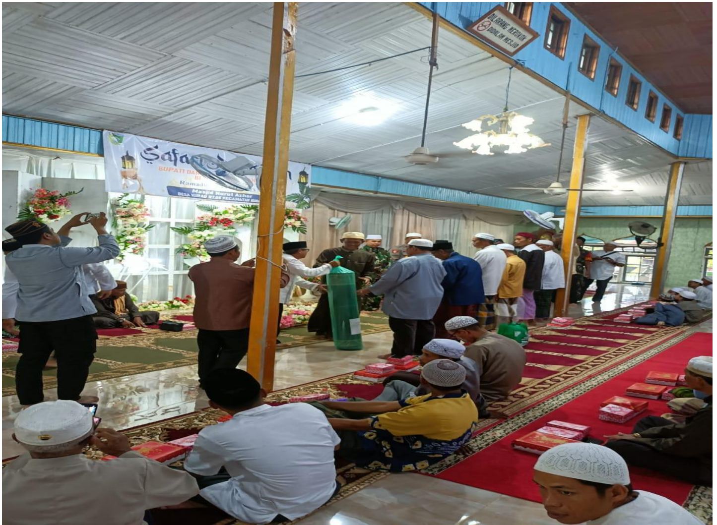
Keterangan : Kegiatan Safari Ramadhan Tahun Anggaran 2024