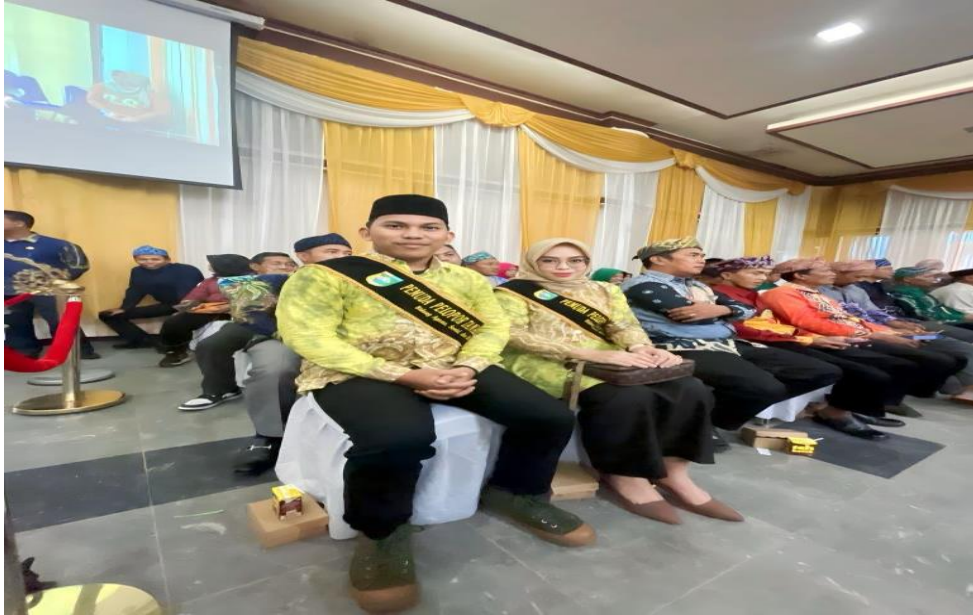
Foto Kegiatan Pemilihan Pemuda Pelopor Tingkat Kabupaten dan Propinsi