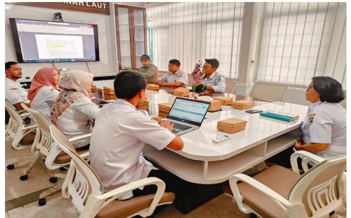
Foto Kegiatan Cek Fisik dan Ekspose 2024

Laporan Hasil Pemeriksaan yang telah terbit sebanyak dokumen tersebut telah disampaikan kepada obrik untuk dilakukan tindak lanjut.