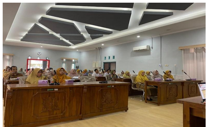
Kegiatan Sosialisasi SPI 2024

Kemudian pada sasaran ini juga didukung dengan indikator Persentase 43 hasil rekomendasi SPI yang di tindak lanjuti , Kabupaten Tanah Laut telah menindaklanjuti rekomendasi SPI tahun 2023 sesuai dengan indikator di MCP.