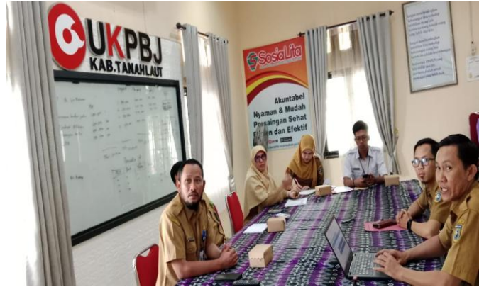
Kegiatan Tindak Lanjut Hasil Pemeriksaan 2024

Hambatan – hambatan yang ditemui dalam pelaksanaan kegiatan untuk mencapai sasaran ini adalah