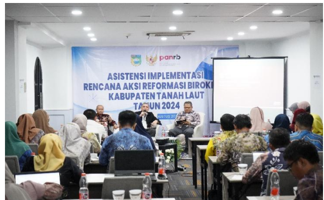
Kegiatan Asistensi Implementasi Rencana Aksi Reformasi Birokrasi