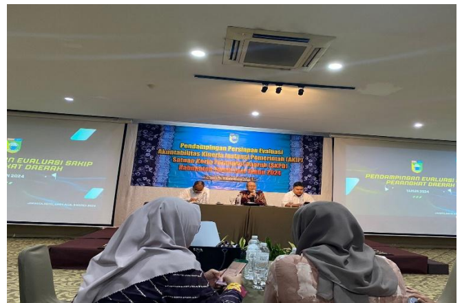
Pendampingan Persiapan Evalasi SAKIP SKPD