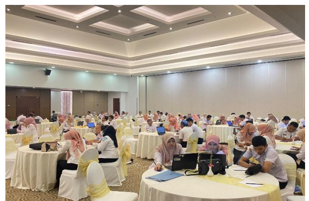
Finalisasi Hasil Evaluasi Internal SAKIP SKPD

Untuk mendukung sasaran ini maka didukung juga dengan indikator “ Perangkat Daerah yang menindaklanjuti Laporan Hasil Evaluasi SAKIP ” rekomendasi dalam laporan hasil evaluasi AKIP yang dilaksanakan APIP harus