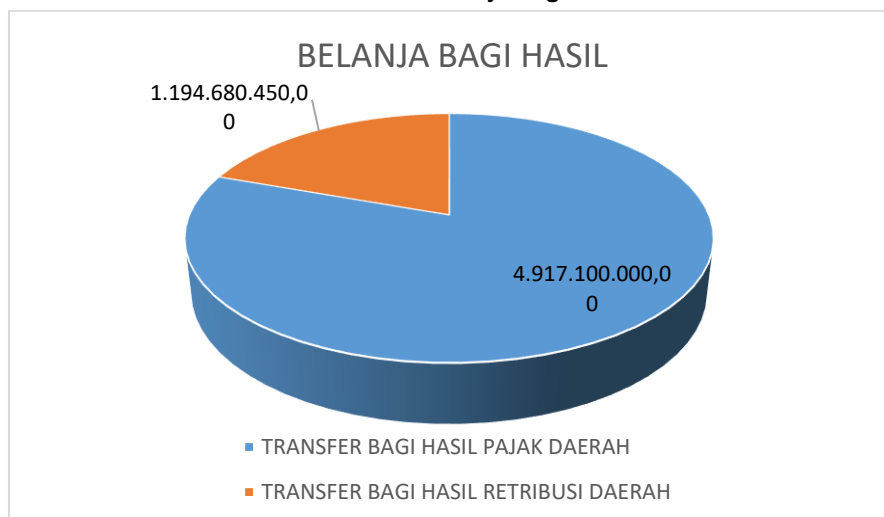
Grafik 1 Realisasi Belanja Bagi Hasil 2023

Belanja Bagi Hasil Pendapatan untuk tahun 2023 dan 2022 terdiri dari Belanja Bagi Hasil Pajak Daerah sebesar Rp4.917.100.000,00 dan Belanja Bagi Hasil Retribusi Daerah sebesar Rp1.194.680.450,00.