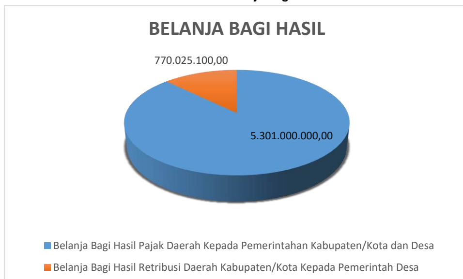
Grafik 1 Realisasi Belanja Bagi Hasil 2024

Belanja Bagi Hasil Pendapatan untuk tahun 2024 terdiri dari Belanja Bagi Hasil Pajak Daerah sebesar Rp5.301.000.000,00 dan Belanja Bagi Hasil Retribusi Daerah sebesar Rp770.025.100,00.