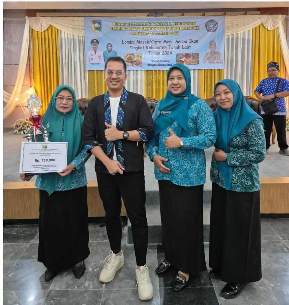
Lampiran 2. Juara Lomba Masak Menu Serba Ikan Tingkat Kabupaten