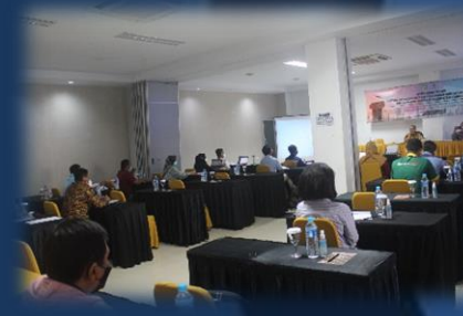
Bimbingan Teknis Pengisian LKPM