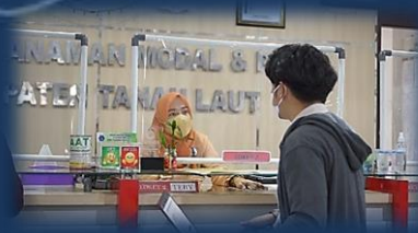
Pelayanan Perizinan Berusaha