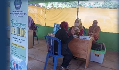
Pelayanan keliling di Desa