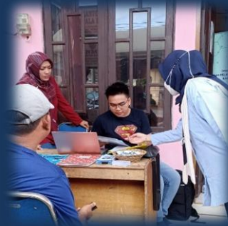
Bimbingan Teknis OSS di Desa