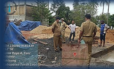
Cek Lapangan Permohonan IMB