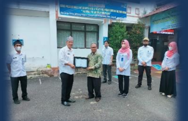
Penyerahan Penghargaan Kepada Pemohon