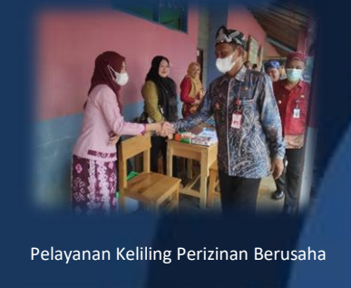
Pelayanan Keliling Perizinan Berusaha